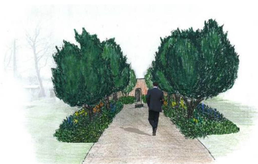
Sadová úprava památníku žldovského hřbitova Vizuallzace navrhovaného řešení